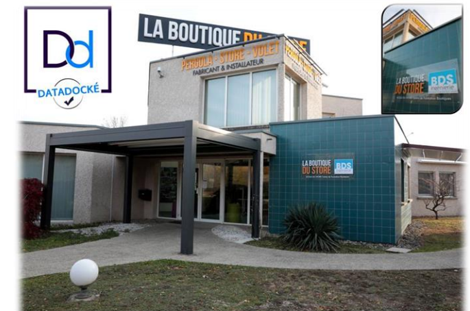
L'ÉCOLE DU STORE

Après démarrage : stages de mise à niveau technique, de formation commerciale, de gestion ou d'exploitation